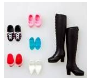
シューズセット (1,260円)