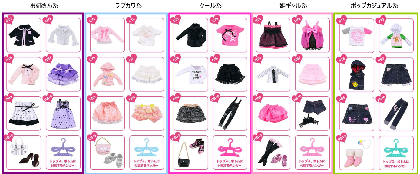
ウェアボックス (9月発売35種・11月発売25種 / 各630円)