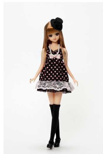
シンボルジェニー (3,360円)